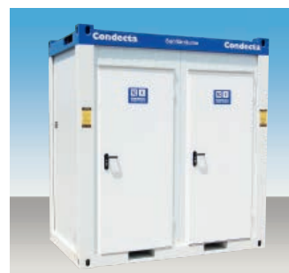
TK 24 2 separate WC-Kabinen 2 Waschbecken