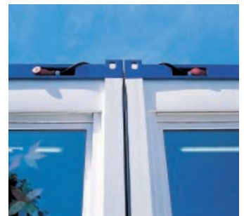
Steckbare Elektroverbindung von einem Modul zum anderen.