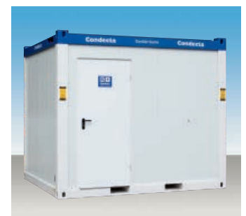
TK 240 D 1 Dusche, 1 Toilette 1 Waschbecken