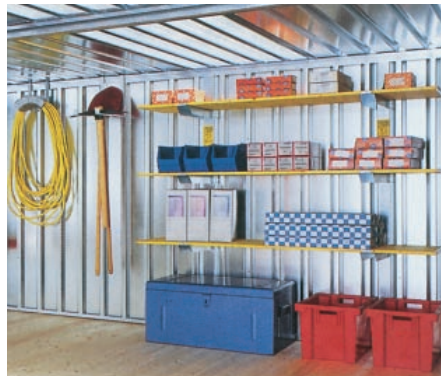
Regalstützen und Werkzeughalter